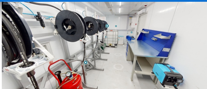
Цех по сбору и раздаче масла