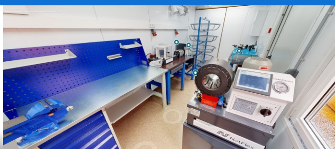
Цех по ремонту РВД