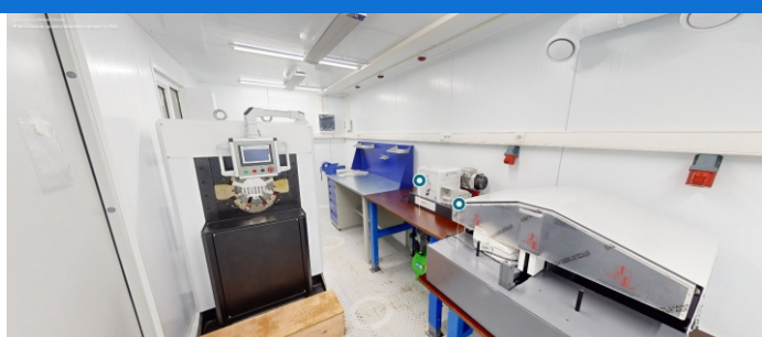
Цех по ремонту РВД